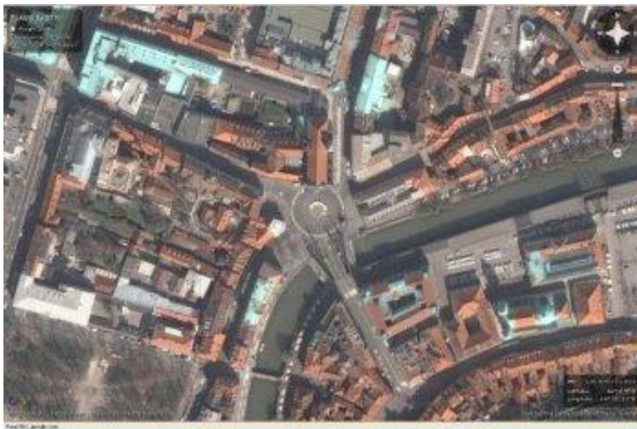
Slika 2: Ljubljana »Tromostovje«, vir: Google Earth 2009