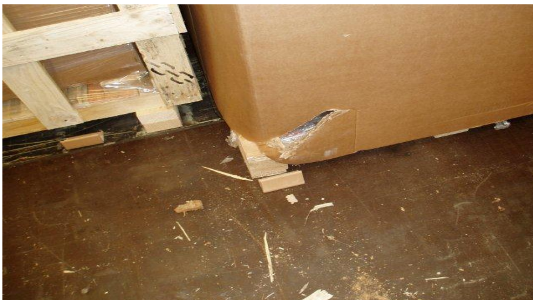
Slika 3: Pošiljka "prebodena" ob manipulaciji z viličarjem

3) Letos smo v naše skladišče pripeljali pošiljko iz Nizozemske za našega komitenta, ki je blago prodal naprej v Srbijo. Ob raztvoru pošiljke je viličarist ob obračanju kolija ponesreči "prebodel" z vilico viličarja pošiljko in jo poškodoval. Ker je pošiljka imela krito dodatno kargo zavarovanje z dodatno skladiščno manipulacijo, kar je pri končni ceni premije nanese dodatnih 10% višjo ceno zavarovanja, je bila celotna škoda izplačana iz naslova kargo zavarovanja. Če pošiljka ne bi imela kritega dodatnega kargo zavarovanja blaga in dodatne skladiščne manipulacije, bi morali škodo kriti sami, saj edino kargo zavarovanje krije poškodbe storjene med skladiščno manipulacijo blaga (razklad, naklad, manipulacija v skladišču ...).