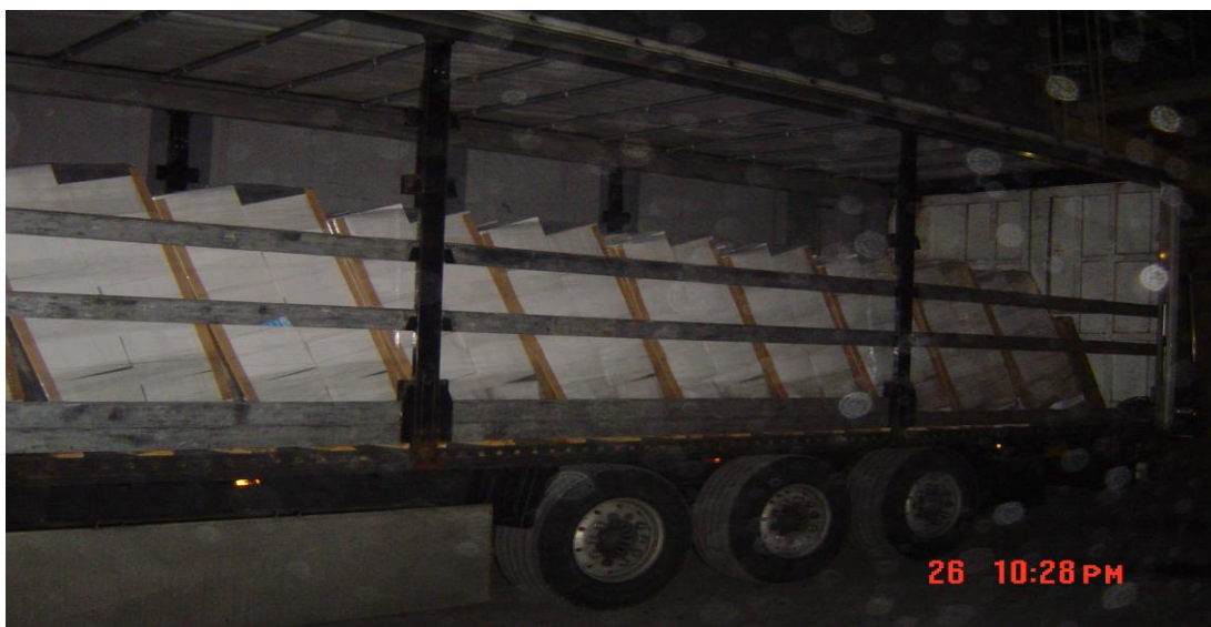
Slika 2: Palete naslonjene ena na drugo

3) Letos smo v naše skladišče pripeljali pošiljko iz Nizozemske za našega komitenta, ki je blago prodal naprej v Srbijo. Ob raztvoru pošiljke je viličarist ob obračanju kolija ponesreči "prebodel" z vilico viličarja pošiljko in jo poškodoval. Ker je pošiljka imela krito dodatno kargo zavarovanje z dodatno skladiščno manipulacijo, kar je pri končni ceni premije nanese dodatnih 10% višjo ceno zavarovanja, je bila celotna škoda izplačana iz naslova kargo zavarovanja. Če pošiljka ne bi imela kritega dodatnega kargo zavarovanja blaga in dodatne skladiščne manipulacije, bi morali škodo kriti sami, saj edino kargo zavarovanje krije poškodbe storjene med skladiščno manipulacijo blaga (razklad, naklad, manipulacija v skladišču ...).